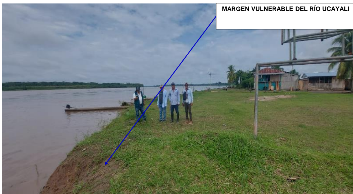
FIGURA N°01: TRAMO CRÍTICO EN EL RÍO UCAYALI , EN EL CASERIO DE PUCAPANGA, DISTRITO DE SARAYACU, PROVINCIA DE UCAYALI - DEPARTAMENTO DE LORETO.