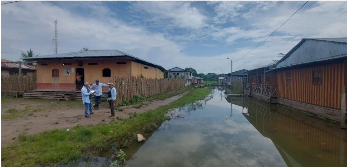
FIGURA N°03: EN LA TEMPORADA DE MAXIMAS AVENIDAS, EL RÍO UCAYALI SE DESBORDA AFECTANDO DE LAS VIVIENDAS MAS SERCANAS AL BORDE DEL RIO, COMO TAMBIEN EXPONIENDOSE A MULTIPLES ENFERMEDADES COMO EL DENGUE Y LA MALARIA